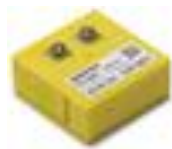
温度測定ユニット WM1000