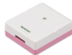
ひずみ測定ユニット WM2000SA