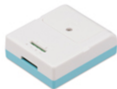
2ch温度/電圧測定ユニット WM2000TA