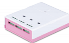
3ch動ひずみ測定ユニット WM2000SA