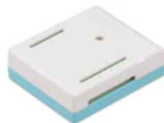
7ch温度/電圧測定ユニット WM2000TB