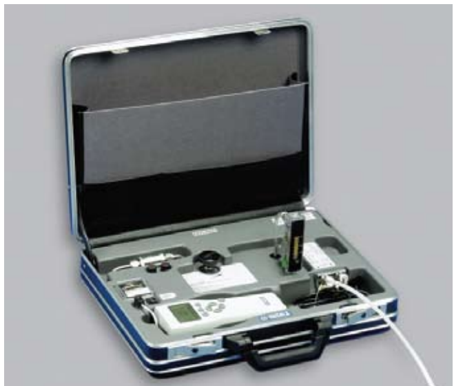
完全一体型サンプリングシステムDSS70Aは、露点センサの汎用性を広げ、正圧下でない他のプラントのプロセス測定も実現しています。