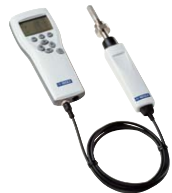
ヴァイサラDRYCAP®ハンディタイプ露点計

飽和水蒸気圧は、厳密に温度関数です。例えば、20°C (68°F) における水蒸気の最大分圧は23.5mbarです。23.5mbarの値は、20°C (68°F) における「飽和水蒸気圧」と言われています。20°C (68°F) の「飽和した」環境では、さらに水蒸気加わると、結露が発生します。この結露の現象は、水分量（水蒸気）の測定に活用できます。