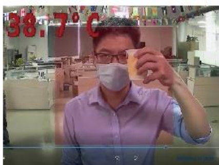
『基準を超えています』