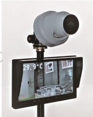
体表面温度自動測定・低価格