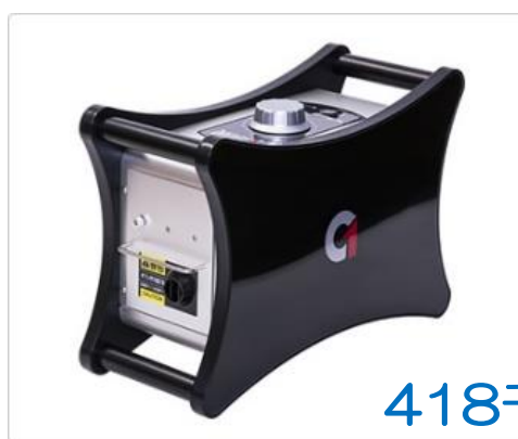
剛腕 1400 GWN-1400FR