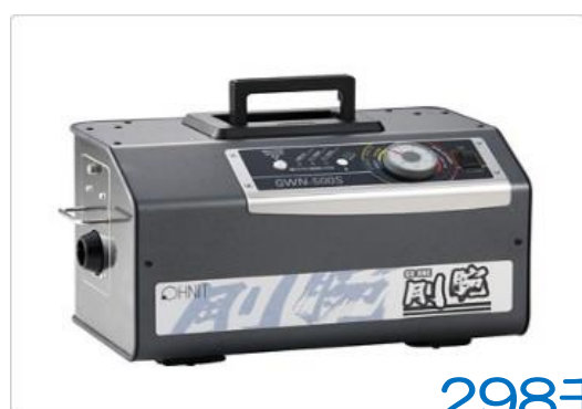
剛腕 GWN-500S GWN-500S