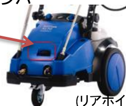
(リアホイール) (オイルサイト)