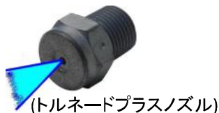
(トルネードプラスノズル)

○特許取得のトルネードプラスノズルは両端に渦巻き状の水 flow を起こし、従来のノズルの洗浄むらをなくし、均一な洗浄を実現