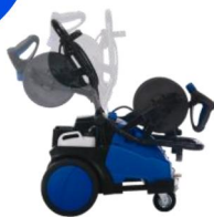
(折りたたみ式ハンドル)