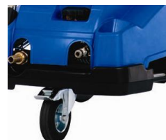
(フロントキャスター)