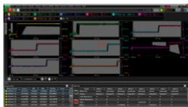
PMICパワーアップ・シーケンスマスク試験

PMIC (電源管理集積回路) で求められる厳密な電源投入タイミング制御の検証が可能です。8チャンネル同時マスク試験機能で、どの電源のタイミングが何回エラーを起こしているのかを瞬時に確認できます。